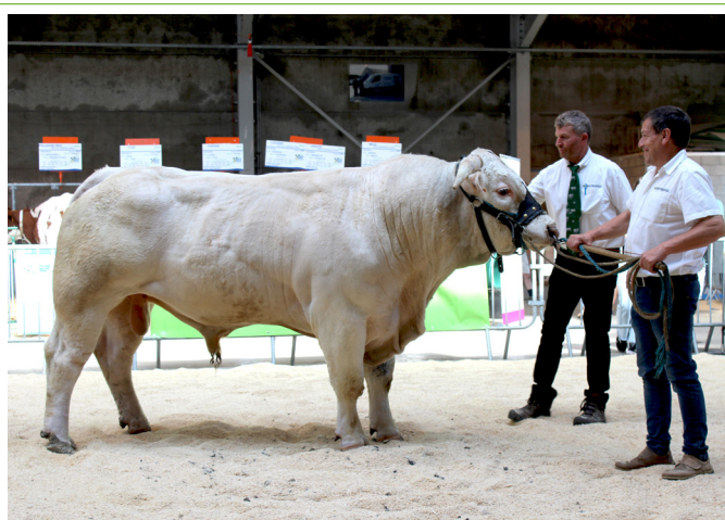
La race Blanc-Bleu Belge, Charolaise, Rouge-Pie de l'Est, Bleue Mixte, ainsi que les autres races faisaient l'objet d'une présentation dans le ring.