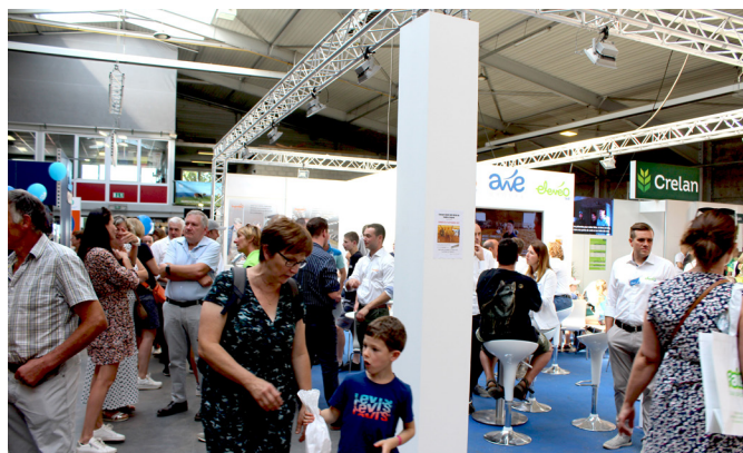
Le stand awé groupe en toute convivialité.