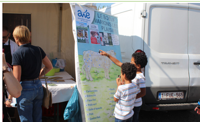
Des dégustations de viande, des moments d'échange essentiels avec les consommateurs.