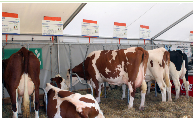
La plupart des Herd-Books étaient présents avec des animaux. Ici la Blonde d'Aquitaine et la Montbéliarde.