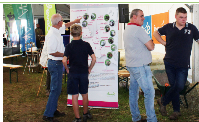
Notre Service Ovin-Caprin présent pour la première fois à Battice.