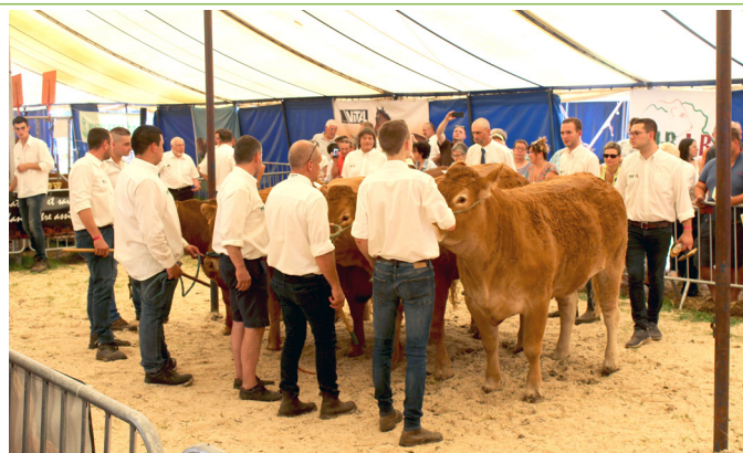
Le show junior Holstein et le concours Limousin, des moments bien appréciés des éleveurs et des éleveurs en devenir.